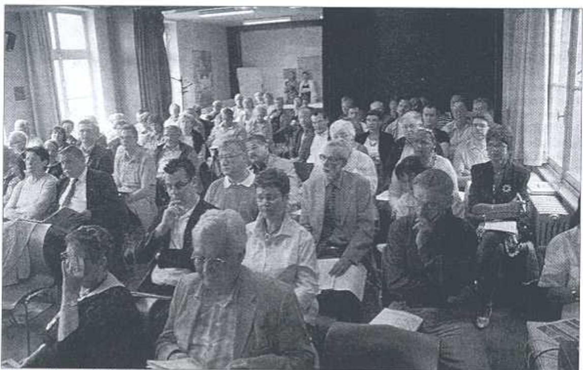
L'assemblée générale s'est jouée à guichet fermés comme on le dirait dans le jargon footballistique.