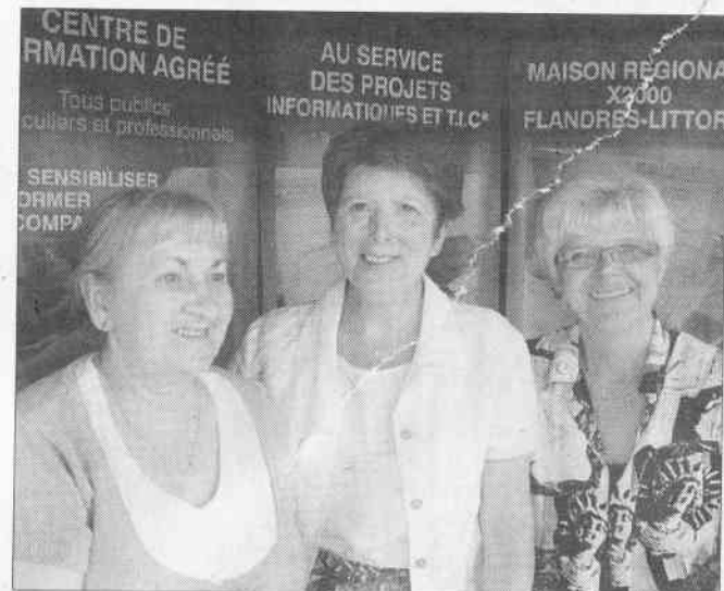
Deux membres de l'asso SEL des Flandres cohabitant avec la salariée de X2000