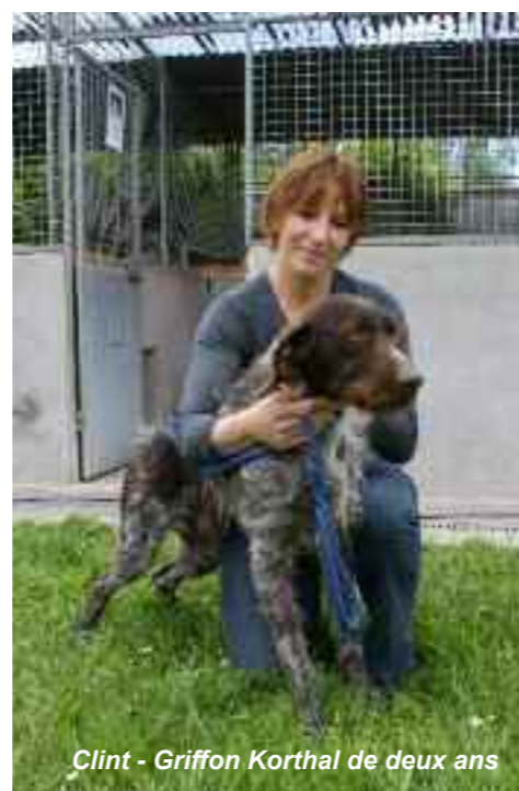
Clint - Griffon Korthal de deux ans

Plus de 100 000 animaux abandonnés chaque année en France. La Société de Protection des Animaux (SPA) craint que la crise n'accroisse ce phénomène. Pour lutter contre ce fléau, la SPA a lancé une campagne nationale du 18 au 24 mai 2009 pendant le Festival de Cannes pour dénoncer cette situation qui perdure de manière chronique depuis trop longtemps.