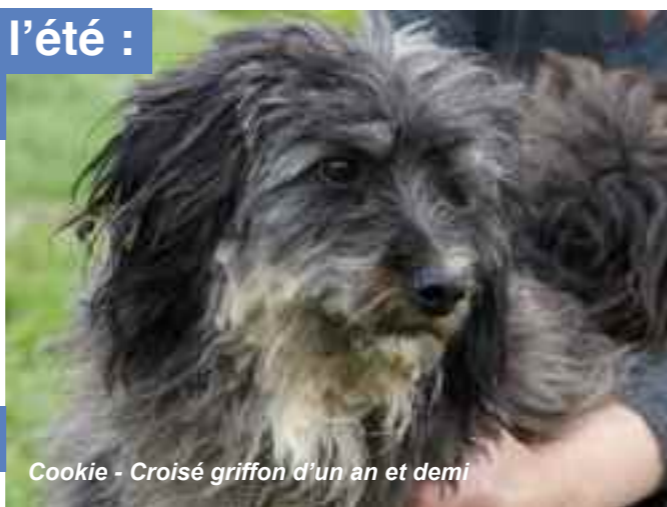
Cookie - Croisé griffon d'un an et demi

Renseignements : Audrey VANHEE Rue des Scieries à DUNKERQUE 03 28 61 12 00 ou spa.dunkerque@orange.fr www.chenil-refuge-dunkerque.org Du lundi au samedi inclus : 10h00 à 12h00 et 14h00 à 17h30